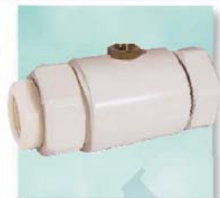
Клапан открыт / valve opened