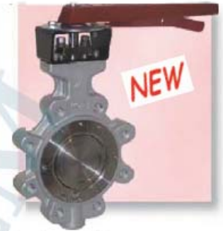
На изображении LUG исполнение (доступно по запросу) Picture shows LUG-type (available on request)